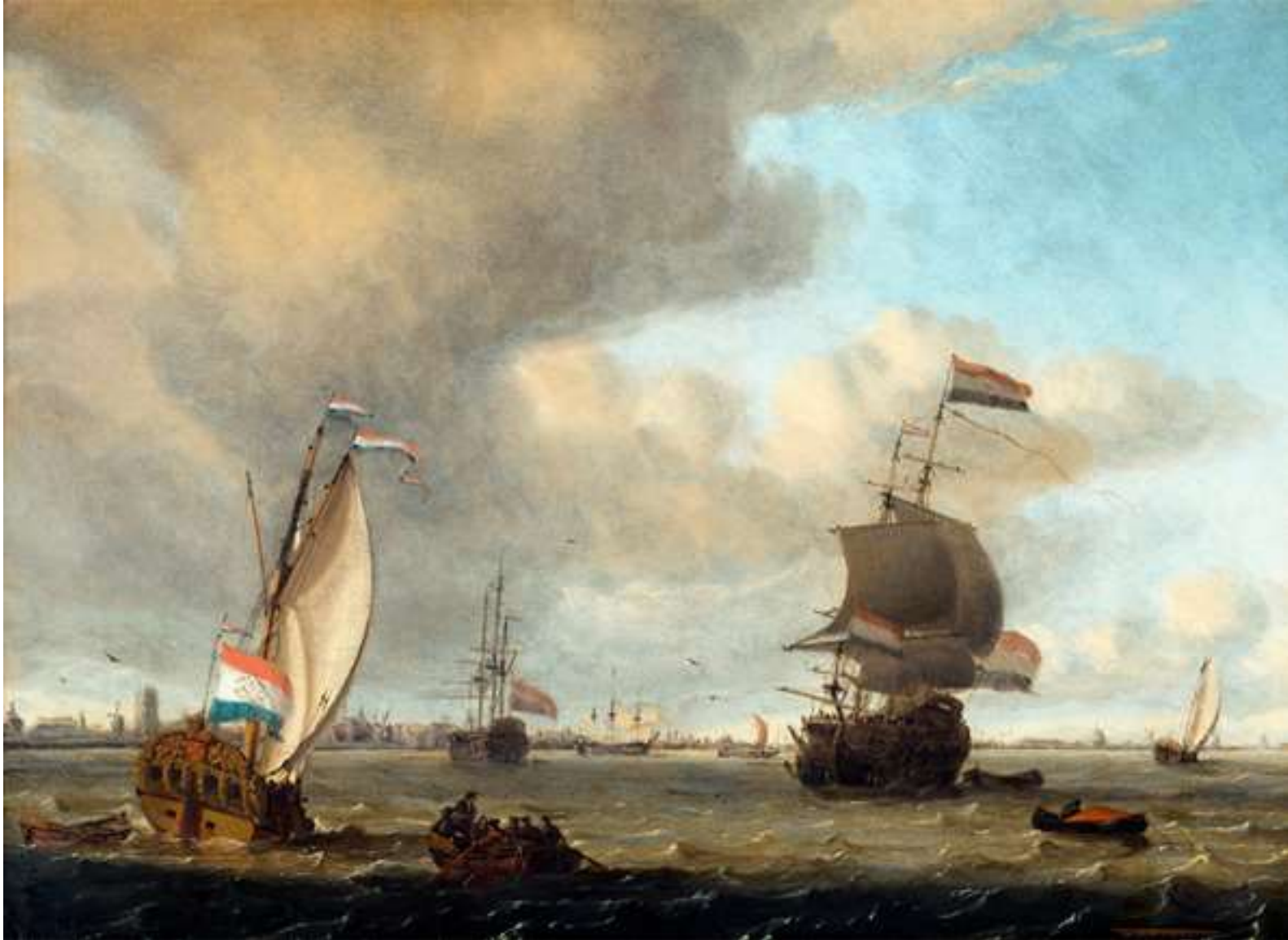
Zeventiende-eeuws gezicht op de Maas voor Rotterdam met links De Boompjes en de toren van de Laurenskerk.